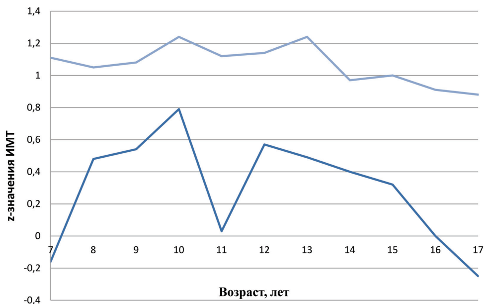
Рисунок 1. Доверительные интервалы медианных значений ИМТ в группах обследованных московских мальчиков на фоне референтных данных ВОЗ в зависимости от возраста Figure 1. Confidence intervals of age-related median BMI z-scores in Moscow boys compared with WHO reference data